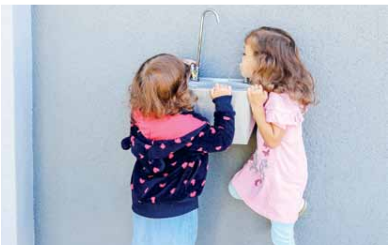
Die kleinen Ladies löschen ihren Durst beim neuen Wasserbrunnen.