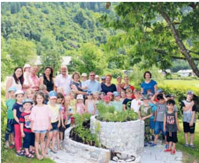
Die Kinder des Kindergartens Treffen und das Kindergartenteam mit den Sponsoren der Kräuterschnecke