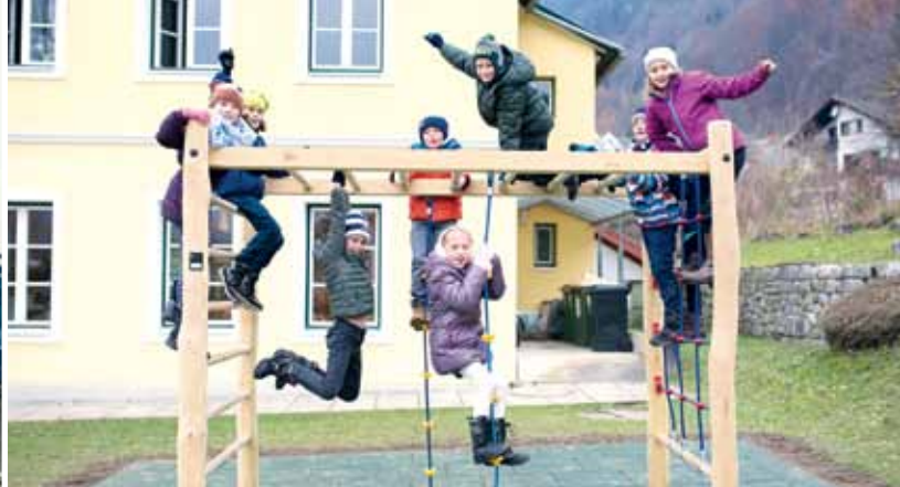
Das neue Klettergerät ist fantastisch finden die Kinder der VS Sattendorf.