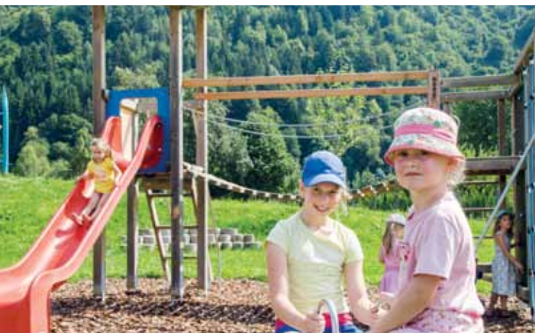
Rutschen, Schaukeln, Klettern, das macht Spaß!