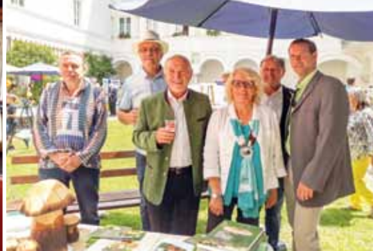
Abschlussfest in Wernberg