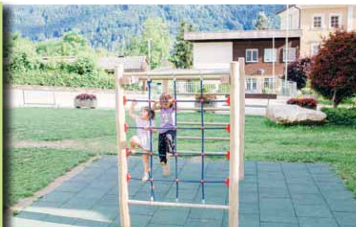
Da kann man herrlich Herumturnen.