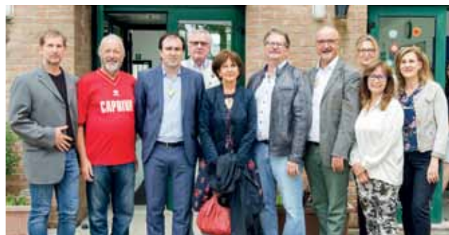
Die Delegationen aus den Gemeinden und Volksschulen Capriva und Treffen