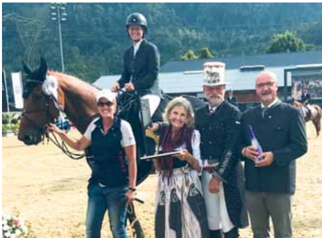
Siegerin des Hauptbewerbes des Glock's 5* Grand Prix in Treffen am 10. Juni 2018 war Elizabeth MADDEN "Beezie" (USA) auf dem Pferd Coach