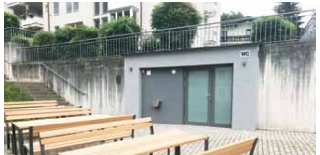
WC-Anlage und Rastplatz

Wir wünschen einen schönen Sommer und verbleiben mit lieben Grüßen