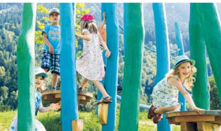
Der Motorik-Park begeistert die Kinder.