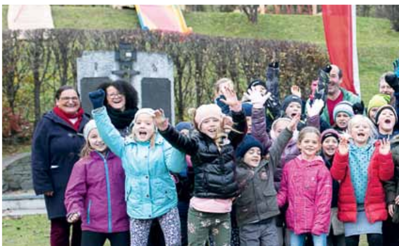
Im Herbst vorigen Jahres erfolgte die Eröffnung des Kinderspielplatzes in Sattendorf