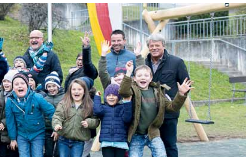
– Man sieht den Kindern ihre Freude über die neuen Spielgeräte an.