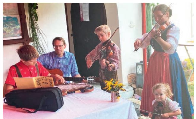
Die Pfarrersfamilie beim Musizieren