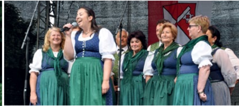
Der Gemischte Chor Gegendal stellte sich mit einem bunten Liederstrauß ein, die Öhringer dankten mit viel Applaus.