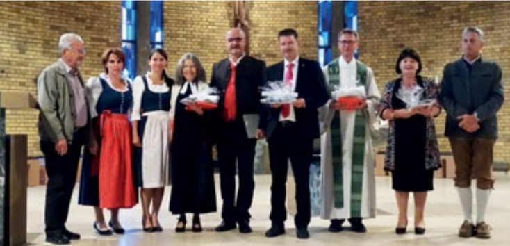
Treffen und Öhringen stehen auch für gelebte Ökumene. Das untermauerte das Freundschaftsfest eindrucksvoll.