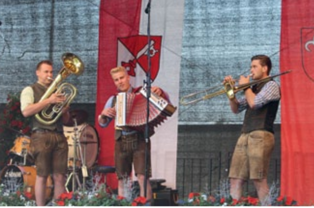
Das „Junge Trio MOS“ spielte zünftig auf und sorgte für ausgezeichnete Stimmung.