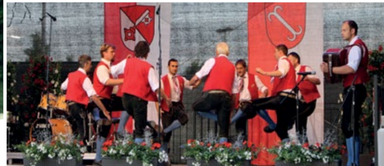
Die Schuhplattler Almrausch aus Sattendorf zeigten den Öhringern wie wir unsere Traditionen leben.