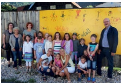
Expositurklasse VS Einöde