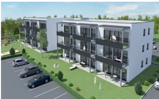
meine heimat - Neubau Treffen