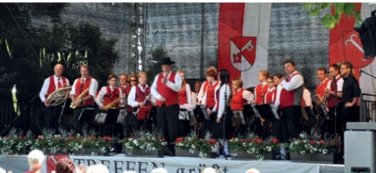
Zackig, rhythmisch, vielfältig und auf hohem Niveau: Die Marktmusik Treffen beeindruckte das Publikum mit ihren Klängen.