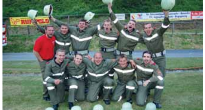
Team 3. Platz Silber A - qualifiziert f. Landesmeister