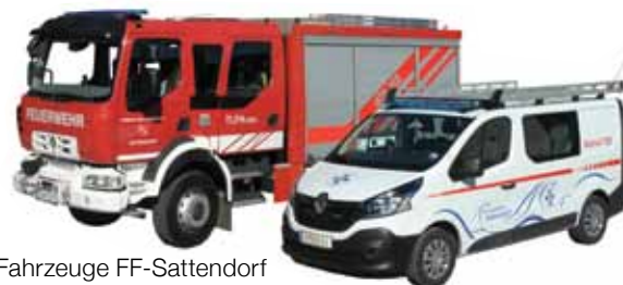
Neue Fahrzeuge FF-Sattendorf und ÖWR Sattendorf