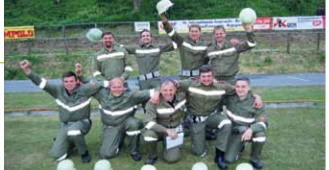
Abschnittsmeister und 3. Platz beim MLB