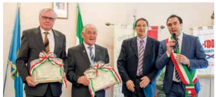
Die neuen Ehrenbürger von Capriva