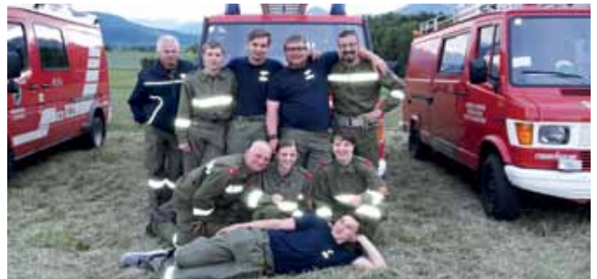
Bewerbsgruppe FF Treffen