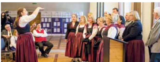
Der Gemischte Chor Gegendtal beim Auftritt in Capriva