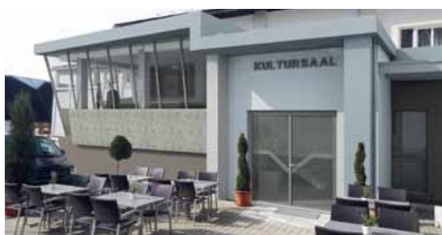
Ansicht des neuen Eingangsbereichs