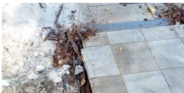
Massive Vermorschung der Holzkonstruktion – höchste Zeit für die Erneuerung