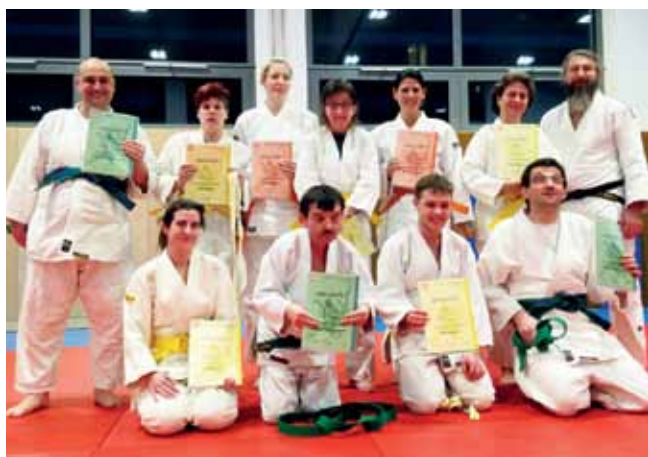
Sportlergruppe der Diakonie

Mobil: 0664/24 27 986, Email: markus@judo-treffen.info