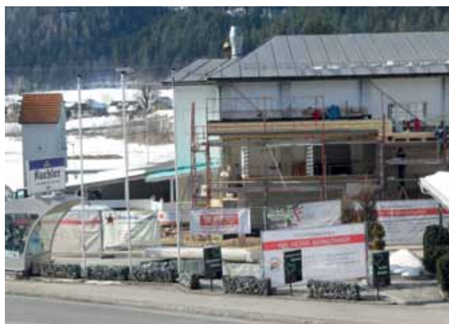
Mitten im Bau